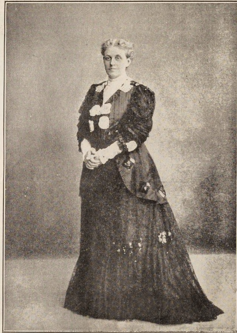
Mrs. Carrie Chapman Catt.

An interesting portrait of the Founder of the Alliance, whose absence from the Congress is regretted by all, as she appeared at the time of its inception in 1904.