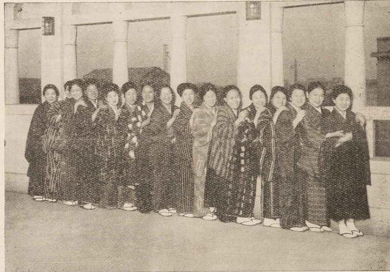
A Business Girls' Club in Tokyo.

The facts and figures of my programme in Beirut were something like this. Our main effort and emphasis was put upon two Leadership Training courses held in the Association. The first was for the community with an average attendance of 85 at each class, composed of teachers, guide or scout leaders, nurses, etc. Of this group we usually had as many as 50-65 playing in the games. There were approximately 23 institutions represented, of which about one-third of the group were from government schools. The second course was for our own association leaders in girls' work, the Staff