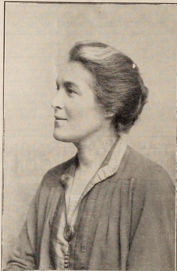
MARGERY I. CORBETT ASHBY.

Our pioneers blazed a trail, trusting in women's capacities and their high sense of duty. To-day a