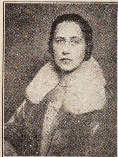
LADY DE VILLIERS, South Africa