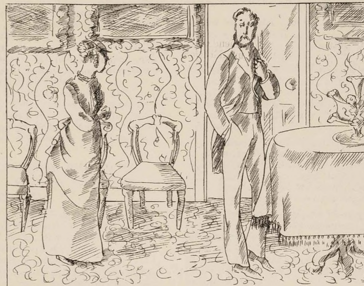
19th Century Wife, in the face of domestic ruin: But how have we lost all our money?

19th Century Husband: My dear, women cannot understand finance.