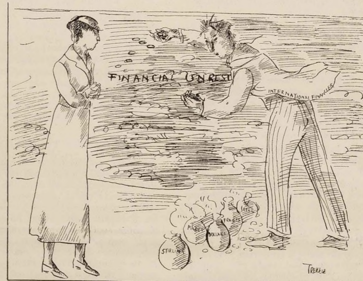
20th Century Woman, in the face of international economic chaos: But how have we got into this state?

19th Century Husband: My dear, women cannot understand finance.